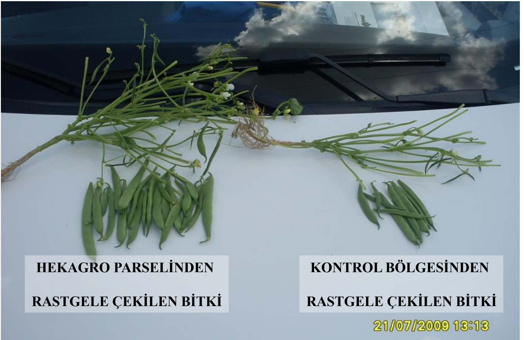
HEKAGRO PARSELİNDEN RASTGELE ÇEKİLEN BİTKİ